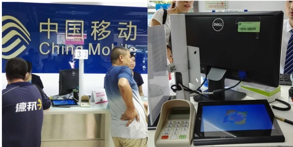
（上图为 TD101WE 系列电磁手写屏）